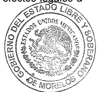
MÓNICA SÁNCHEZ LUNA SECRETARIA GENERAL DEL TRIBUNAL ELECTORAL DEL ESTADO DE MORELOS

SECRETARIA GENERAL TRIBUNAL ELECTORAL DEL ESTADO DE MORELOS