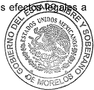
MÓNICA SÁNCHEZ LUNA SECRETARIA GENERAL DEL TRIBUNAL ELECTORAL DEL ESTADO DE MORELOS

SECRETARIA GENERAL TRIBUNAL ELECTORAL DEL ESTADO DE MORELOS