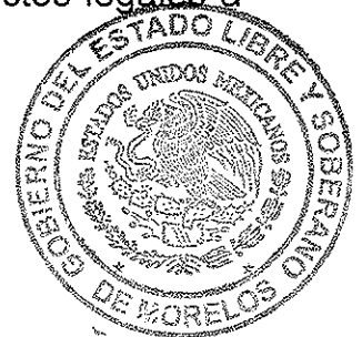
MÓNICA SÁNCHEZ LUNA SECRETARIA GENERAL DEL TRIBUNAL ELECTORAL DEL ESTADO DE MORELOS

SECRETARÍA GENERAL TRIBUNAL ELECTORAL DEL ESTADO DE MORELOS