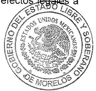
MÓNICA SÁNCHEZ LUNA SECRETARIA GENERAL DEL TRIBUNAL ELECTORAL DEL ESTADO DE MORELOS

SECRETARIA GENERAL TRIBUNAL ELECTORAL DEL ESTADO DE MORELOS