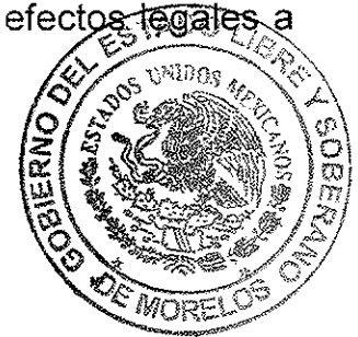
MÓNICA SÁNCHEZ LUNA SECRETARIA GENERAL DEL TRIBUNAL ELECTORAL DEL ESTADO DE MORELOS

SECRETARIA GENERAL TRIBUNAL ELECTORAL DEL ESTADO DE MORELOS