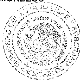
MÓNICA SÁNCHEZ LUNA SECRETARÍA GENERAL DEL TRIBUNAL ELECTORAL DEL ESTADO DE MORELOS

SECRETARÍA GENERAL TRIBUNAL ELECTORAL DEL ESTADO DE MORELOS