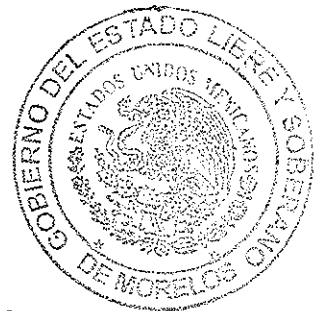
MÓNICA SÁNCHEZ LUNA SECRETARIA GENERAL DEL TRIBUNAL ELECTORAL DEL ESTADO DE MORELOS

SECRETARIA GENERAL TRIBUNAL ELECTORAL DEL ESTADO DE MORELOS