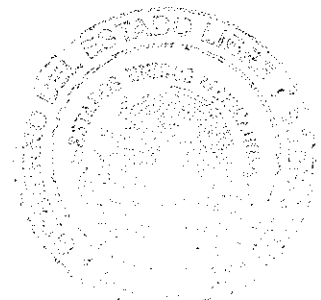
MÓNICA SÁNCHEZ LUNA SECRETARIA GENERAL DEL TRIBUNAL ELECTORAL DEL ESTADO DE MORELOS

SECRETARIA GENERAL TRIBUNAL ELECTORAL DEL ESTADO DE MORELOS