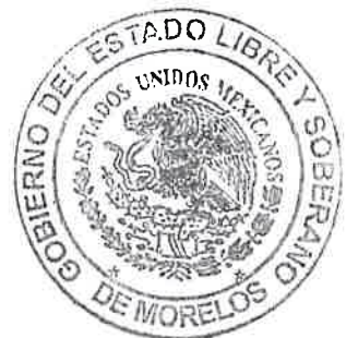
MÓNICA SÁNCHEZ LUNA SECRETARÍA GENERAL DEL TRIBUNAL ELECTORAL DEL ESTADO DE MORELOS

SECRETARÍA GENERAL TRIBUNAL ELECTORAL DEL ESTADO DE MORELOS